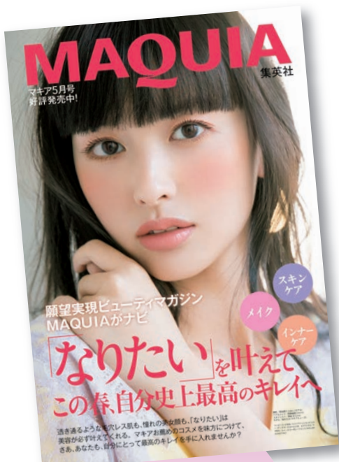
タブロイドイメージ画像

*11月号(9/22売)で2p以上のタイアップが必須です。 *12月号(10/22売)での再編集で希望の場合は調整の上、可否を判断させていただきます。製品カットのみ。コメントの掲載はできません。 *純広は固定面・レギュラー出稿を除きます。