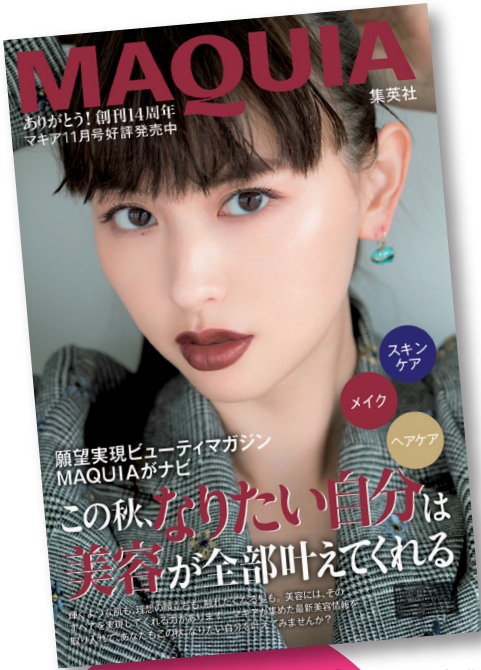
タブロイドイメージ画像

協賛期間 (発売日は予定です) 2019年 4月号 (2/22売) ~ 2019年 6月号 (4/22売)