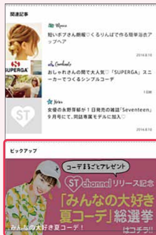
※全編集記事のフッターエリア 4クリエイティブランダム表示となります。 ※動画広告はこちらのみにあります。