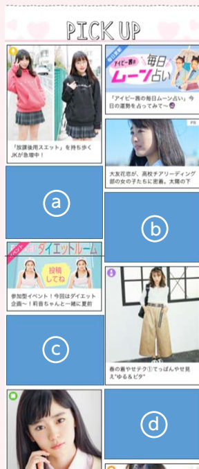
※①～④の内、いずれか1枠を使用します。