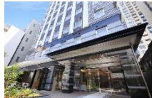
クインテッサホテル大阪心斎橋