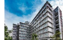
ホテルヒューイット甲子園