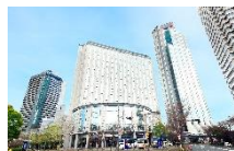
クインテッサホテル大阪ベイ