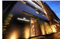
ザ エディスターホテル京都二条