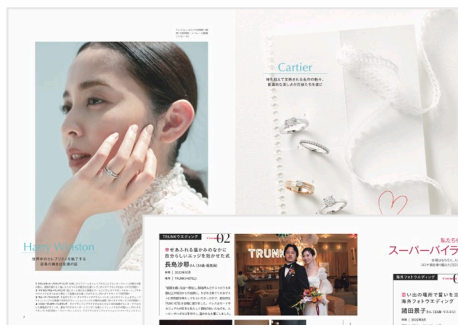
2023年8・9月 合併号の 誌面イメージ