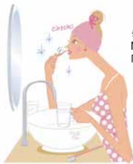
きれいでイラストが MyAge でも人気の 内藤しなこさん

起用 1 名、掲載期間 1 カ月 (アーカイブ有)、想定 7,000PV、 クライアント様サイト (EC 含む) 3 つまでリンク可能、 撮影・イラストは 3 点まで