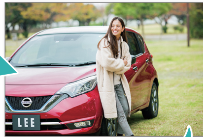
本誌下版イメージ