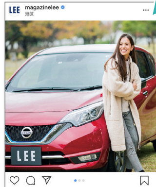
二次使用イメージ