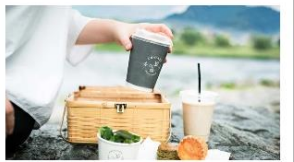
白馬トリノモリ 限定メニュー 白馬トリノモリは、白馬プレミアムリゾートの一角にあり、「白馬トリノモリ」は、白馬プレミアムリゾートの一角にあり...