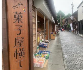
おすすめは「老舗和館」！