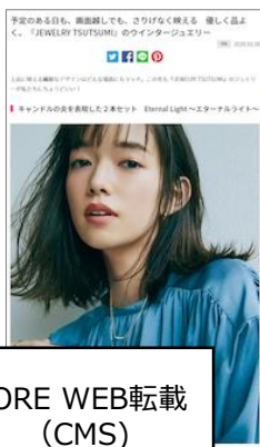
MORE WEB転載 (CMS)