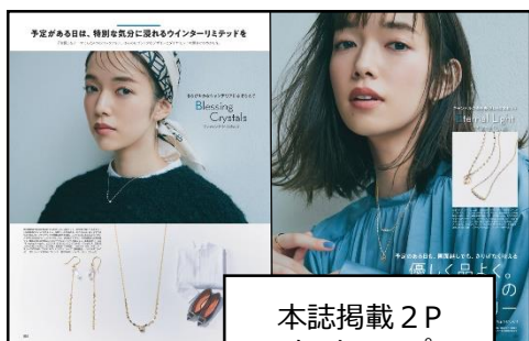
本誌掲載2P タイアップ

MORE本誌2Pタイアップに加え、本誌タイアップをMORE WEBに転載（CMS）、さらに選べるオプションがセットになった大変お得なメニューです。「地域の魅力を、MOREのフィルターを通して全国各地のMORE読者世代に広く届けたい」というご要望を叶えるフルパッケージプランです！外部ブースト、MOREモデル/MOREインフルエンサーズ起用、掲載カット二次使用の中から組み合わせるオプションをお選びいただけます。