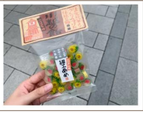
川越の町、川越神社へ行きました。