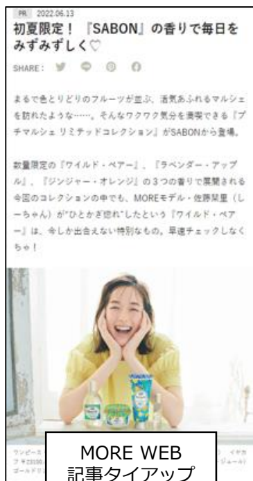
MORE WEB 記事タイアップ (撮影型)

リリース資料や編集部の取材を元に記事を作成し、編集記事と同じデザイン・掲載枠で展開する記事タイアップ広告に、選べるオプションがついたお得なパッケージプランです！外部ブースト、MOREモデル/MOREインフルエンサーズ起用、掲載カット二次使用の中から組み合わせるオプションをお選びいただけます。