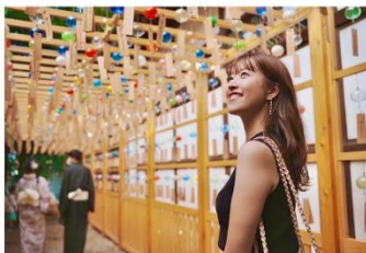
色鮮やかな風情がとっても可愛いですね！