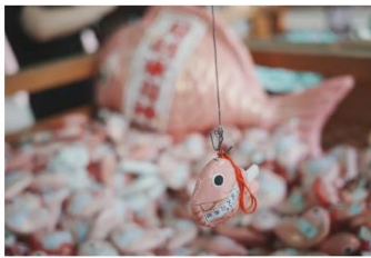
空襲の「あいりんく」で、約平であいりんくしを的のようですが、初めは楽しもうとまきわくわく...