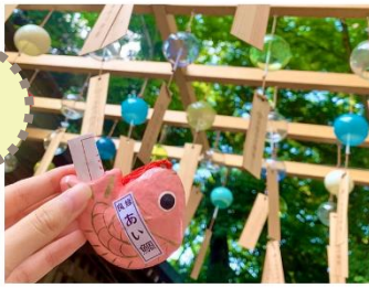
とても楽しかったです！