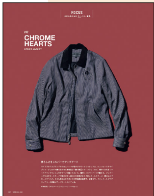
▲巻末コラムFOCUSにてカクハンブツ1カット(1P)で商品紹介