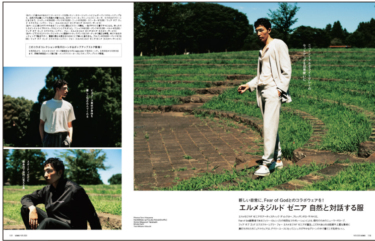
◀本誌2ページタイアップ掲載