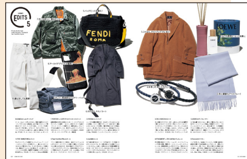
▲巻頭コラムEDITSにてキリヌキブツ1カット(1/5P)で商品紹介