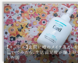
【キュレル】玄関に時のメイク落としを置いてみたら、生活満足度が爆上がりした話