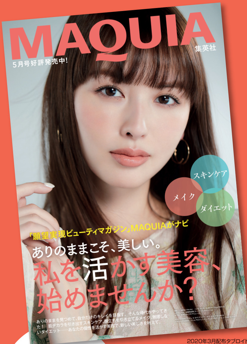
2020年3月配布タブロイド

マキア本誌11月号(9/19売予定)のタイアップを再編集し、タブロイドにして配布する大好評企画。好調なマキア本誌に加え、20万部配布するタブロイドでも幅広い層にリーチできる機会です。