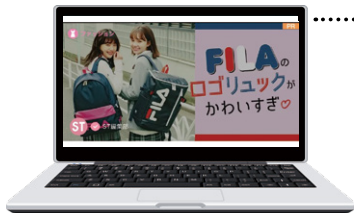
STchannel転載 (アプリ版・ブラウザ版)

本誌のタイアップ・公式アプリSTchannelへの記事転載・選べるSNS拡散をお得な値段で実施いただけます。Seventeenのブランドネットワークを活用できる新企画をぜひお試しください！