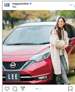
二次使用イメージ