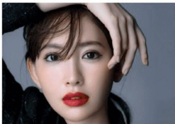
小嶋陽菜 (マキアモデル) @nyanchan22