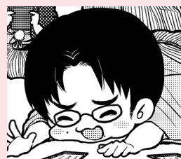
クッキー編集長 松田 充生

26~30歳 = 21.0% / 20~25歳 = 18.0% / 19歳以下 = 9.0%