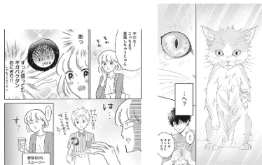
『ジカジョの惑星』（かねこゆかり）『完全ニヤる飼育』（小夏）

2 恋愛のみならず、すべての女性のライフスタイル・ライフステージに寄り添う雑誌だからこそ、さまざまな広告の可能性を探れます！