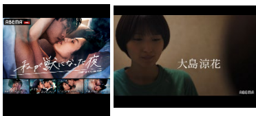
↑ 配信動画キャプチャ