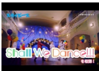
↑ 配信動画キャプチャ 動画後のエンカード→

2021年4月には、YouTuber兼アーティストのスカイピースがりぼんとコラボレーションし、ソニー・ミュージックレーベルズ様から発売した楽曲『Shall We Dance!!!』のダウンロードを動画リワード広告で訴求。マンガMee利用者と相性が良かったこともあり、非常に高いCTRとなりました！