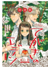
『てがきのエデン』（真山継）

ほぼ全員が初連載というフレッシュな才能が集うまんが誌だからこそ、様々なニーズやリクエストに細やかに対応できる若手作家が数多くいます。描き下ろしも柔軟に対応いたします。