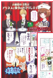
↓2020年9号ロート製菓様 ×『メイちゃんの執事』描き下ろしまんがタイアップ

2020年9号では、ロート製菓様のメンソレータム アクネス×『メイちゃんの執事』4C4P描き下ろしまんがタイアップを実施。新人作家起用からベテラン作家の描き下ろしまで、ぜひご相談ください！