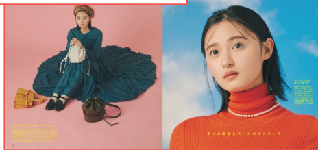
↑2021年2月号『自分にあげたい♡ごほうびジュエリー&amp;ごじまんウォッチ』

non-no編集部では、毎月読者を数名集めてオンラインインタビュー調査を行っています。大学生2・3年生の方も多いため、「成人式はどうだった?」「今度の成人式はどういう予定?」と聞くことも多いです。そこでよく聞こえてくるのは、「『ママ振プラン』で前撮りしました!」という声。『ママ振』というのは、“ママ(お母さん)の振袖”という意味で、『ママ振プラン』というのは、お母さんが着ていた振袖を引き継いで成人式の前撮りをするプランのこと。ここ数年でママ振プランは大学生の間に浸透したようで、「前撮りはママ振で、成人式当日は色味や柄を変えた振袖で行きます!」と2種類の振袖を楽しむ方もいました。