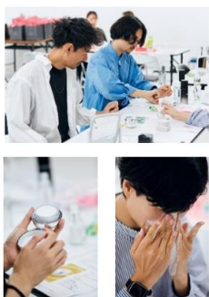
ミニブース + サンプルング