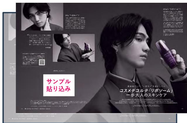
* サンプル貼りタイアップ記事イメージ