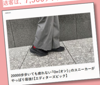
20000歩歩いても疲れない「On(オン)」のスニーカーがやっぱり最強!【エディタズピック】